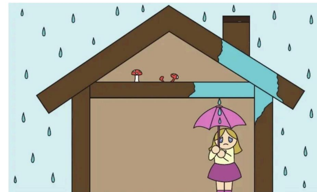
Illustration: Miriam Icoz.